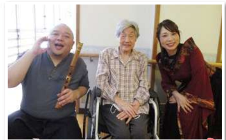
薫風之音様 素晴らしい演奏をありがとうございました！

今回取り組んだことで見えてきた課題を改善することと、ご利用者やご家族にさらに寄り添った看取り介護を提供できると考えます。そのためにも今後多職種間でさらに協力しながら取り組んでいきます。