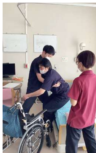
先輩職員の方からたくさんのことを教えてもらいました。