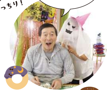
美味しいデザートと楽しい仮装で盛り上がりました★